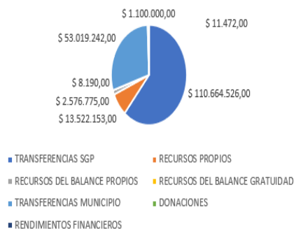
RECAUDO PRESUPUESTO DE INGRESOS VIGENCIA 2024

INSTITUCIÓN ETNOEDUCATIVA SIETE DE AGOSTO